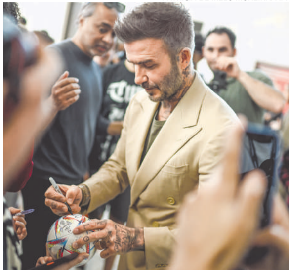
David Beckham asistió al estreno de una serie de televisión llamada "Save our Squad", en Doha