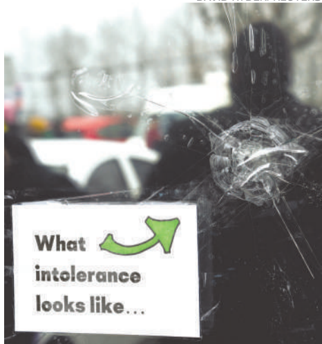
Manifestantes LGBT+ anticipan posibles represalias antes de la "hora mensual de cuentos de drag queen", en Washington