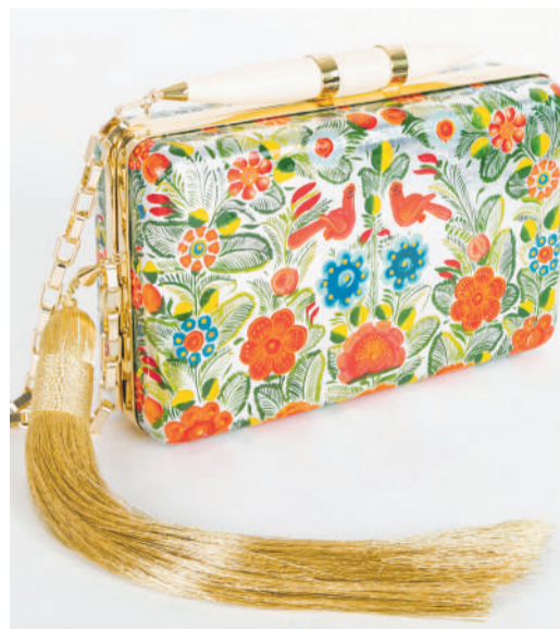
Estos bolsos-joya son pintados a mano

Confiesa que no tiene predilección por una mujer determinada para lucir sus diseños. Dice que en todos los países hay mujeres fabulosas, pero reconoce que cuando ve sus joyas en la ex modelo Nati Abascal, estas “cobran vida”.