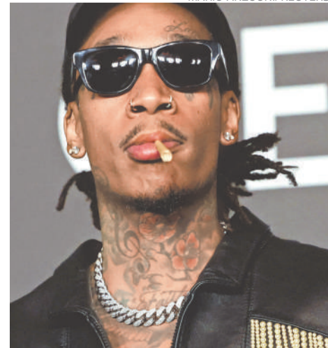
Wiz Khalifa asistió al desfile de modas Celine Otoño Invierno 2023, en el teatro The Wiltern en Los Ángeles, California