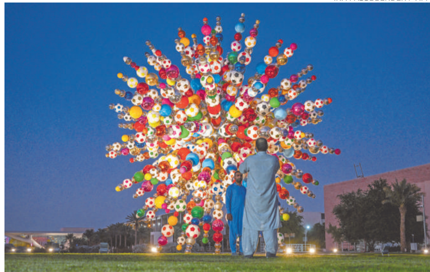
Una escultura titulada "Come Together", de Choi Jeong-hwa, se muestra en Doha, en homenaje a los que hicieron posible la Copa Mundial de la FIFA