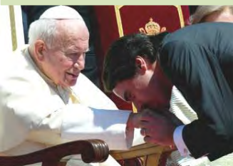
Aznar ante el Papa, postrado, un gesto ancestral en España, el poder civil se inclina ante la Iglesia

En la misma línea el Reglamento de la Ley Hipotecaria, aprobado por el Decreto de 14 de Febrero de 1947 , en su artículo 304: "En el caso de que el funcionario a cuyo cargo estuviese la administración o custodia de los bienes no ejerza autoridad pública ni tenga facultad para certificar, se expedirá la certificación a que se refiere el artículo anterior por el inmediato superior jerárquico que pueda hacerlo, tomando para ello los datos y noticias oficiales que sean indispensables. Tratándose de bienes de la Iglesia, las certificaciones serán expedidas por los Diocesanos respectivos".