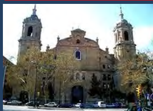
Santiago el Mayor de Zaragoza, inmatriculada en 1987