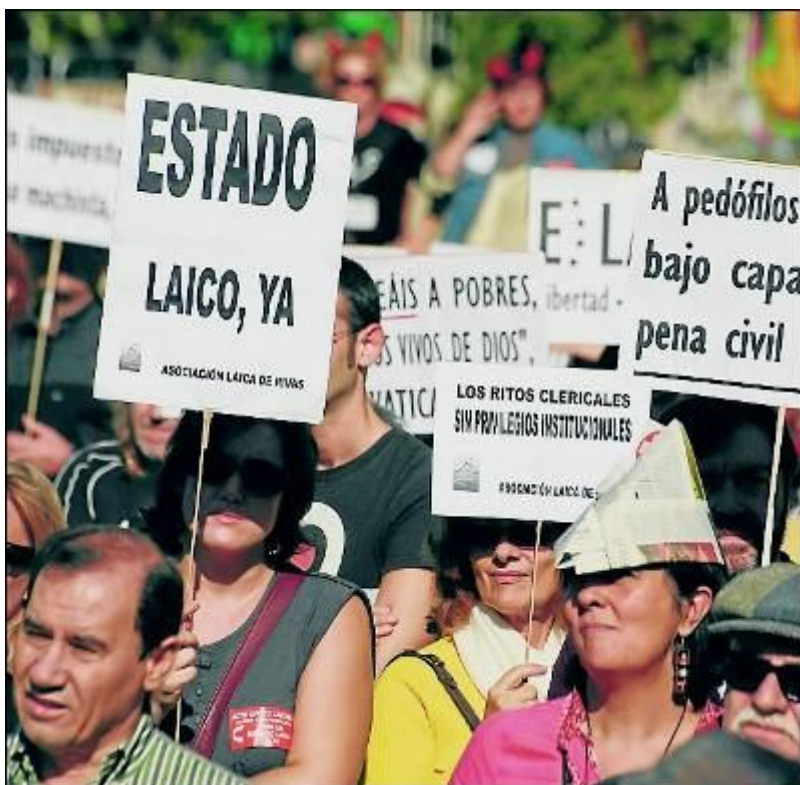
Manifestación por un estado laico en Madrid. R. Sedano

PUBLICO - F. A. - F. G. – SEVILLA - 05/01/11