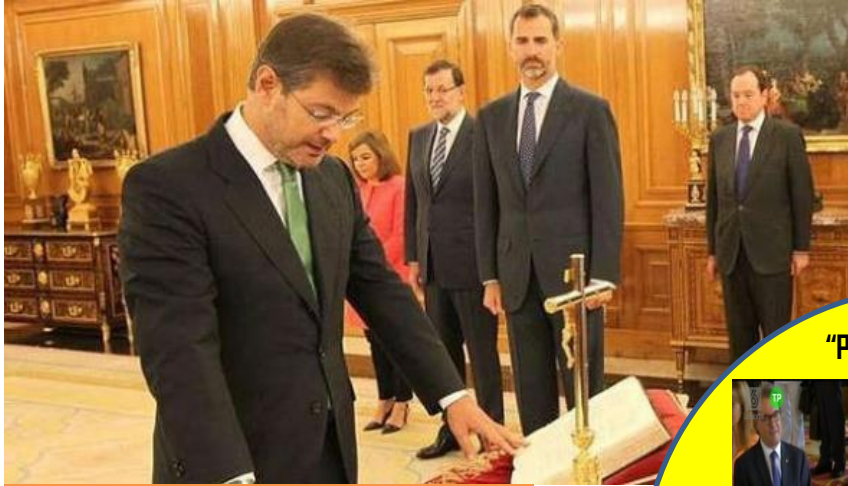
Nuevo Ministro de Justicia 2014