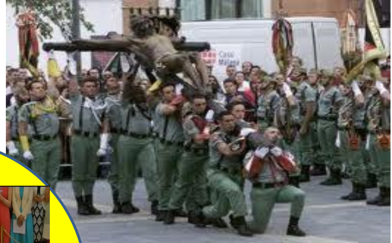
Legión en procesión 2014