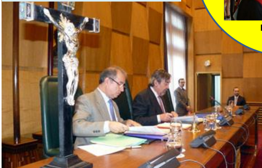
Pleno del Ayuntamiento de Zaragoza. Preside Alcalde Belloch del PSOE. 2014