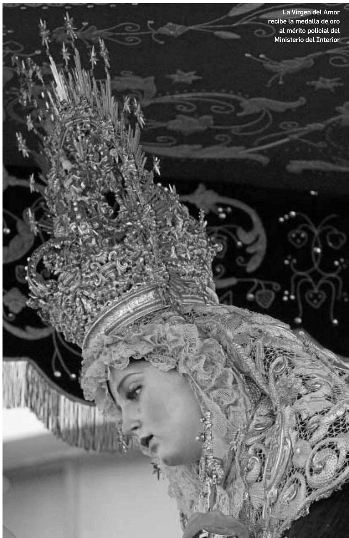
La Virgen del Amor recibe la medalla de oro al mérito policial del Ministerio del Interior