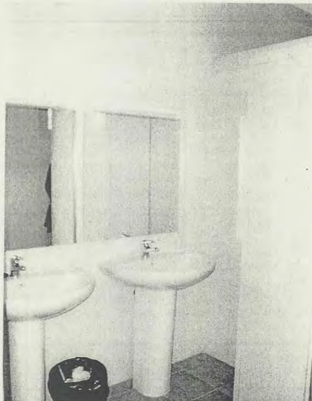
FOTO 3. Aseos contiguos al aula de música