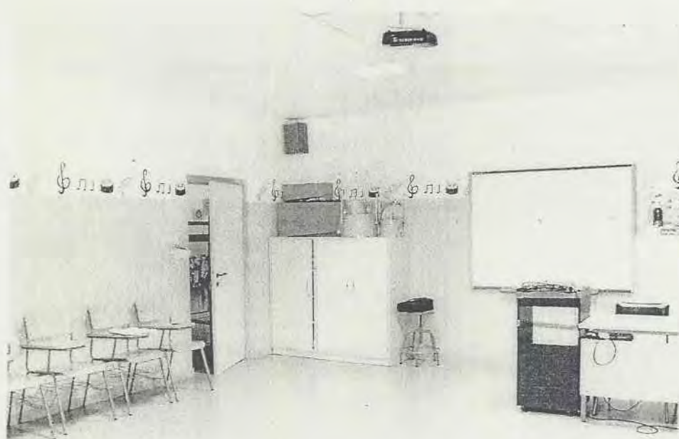
FOTO 1. Aula de música.