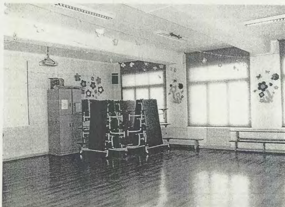
FOTO 2. Sala polivalente -comedor de Infantil.