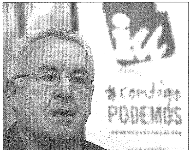
Cayo Lara, coordinador general de Izquierda Unida, en Albacete.

Desde IU, resaltó, no van a consentir que «las pensiones se conviertan en un tema residual en España», porque «hay salud a medio y a largo plazo». Recordó que su partido se movilizará con los