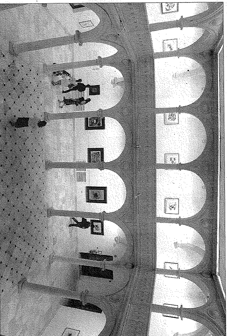
Claustro del Centro Cultural de La Asunción, lugar de la jornada del sábado en horario de mañana.