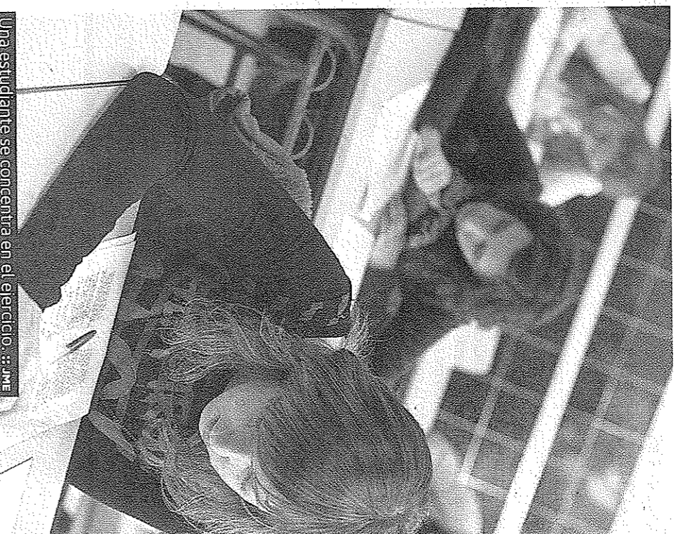
Una estudiante se concentra en el ejercicio.

Precisamente, el caso de Francia servía para poner sobre la mesa los desafíos que se le plantean al laicismo en una sociedad marcada por fenómenos como el de la inmigración. Para Francisco Delgado, sin embargo, el debate es más amplio, ya que «no todos los inmigrantes son religiosos. Se confunde religión con «de dónde vienes»: vienes de Marruecos, pues eres musulmán, y no tiene por qué ser así». Y, en cuanto a símbolos como el velo, la opción parece clara: «Todo símbolo que signifique la vulneración de los derechos humanos, y el velo lo es, hay que intentar desterrarlo; no por la fuerza pero sí por la educación».